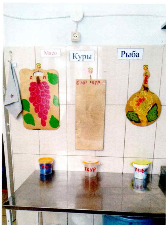
Полотенца в пищеблоке